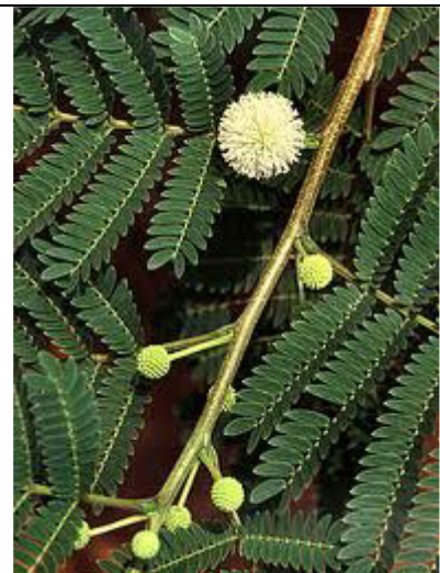
Fleur et feuilles.

www.ctahr.hawaii.edu/forestry/trees/Leucaena_Pterocarpus.html