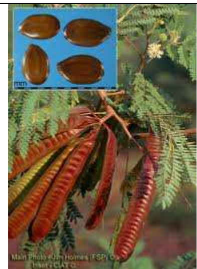
Graines et gousses mûres

www.mi-aime-a-ou.com/Leucaena_leucocephala.php