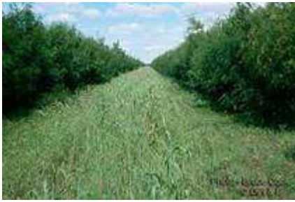
Plantation au Pérou

www.tropicalforages.info/key/Forages/Media/Html/Leucaena_leucocephala.htm