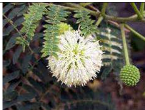
Fleur et feuilles

http://nature.jardin.free.fr/1105/leucaena_leucocephala.html