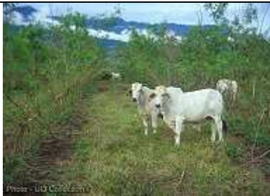
Bétail broutant à Tarramba aux Philippines © UQ Collection

15 mois de repousse sur une parcelle plantée à Tarramba aux Philippines © UQ Collection www.tropicalforages.info/key/Forages/Media/Html/Leucaena_leucocephala.htm