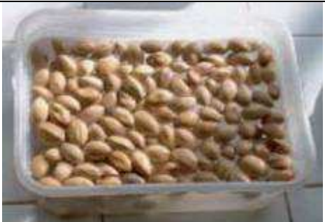
Stratification des graines dans l'eau