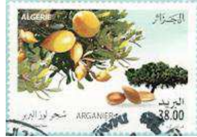
Timbre algérien sur l'Arganier.