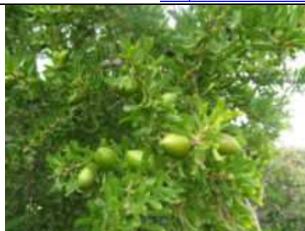
Fruits de l'arganier (région d'Agadir, Maroc).

Huile d'Argan: la richesse du Maroc, http://2emedu-hautrhin.over-blog.com & www.blogouvertsuractu.com/article-maroc-huile-d-argan-huile-tendance-pour-le-1er-producteur-mondial-39639142.html