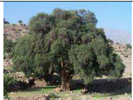
Argania spinosa .

Régions d'introduction connues : Pas de cas connus (Note pour info : cette espèce pourrait être introduite, certainement avec succès, dans beaucoup de régions semi-arides, par exemple, dans le sud de Madagascar, en Namibie, en Inde etc.).