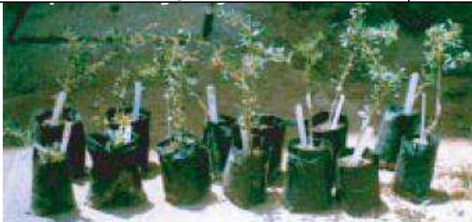
Croissance optimale des plants greffés 1 an après l'opération de greffage.