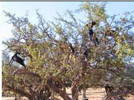
Chèvres dans un arganier (région d' Essaouira , Maroc); l'arganier est aussi un « pâturage aérien » qui assure en tout le fourrage d'environ 2 millions de ruminants 2 .