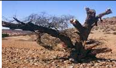
Confrontée à la sécheresse, la population coupe des arbres.