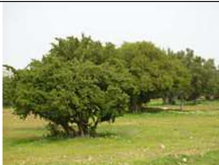
Arganier, région d' Essaouira , Maroc.