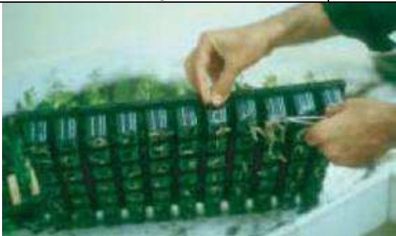
Habillage des racines