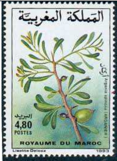
Timbre Argania spinosa, (Maroc) http://aildoux.tripod.com