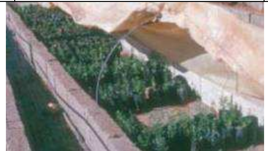
Acclimatation des plants