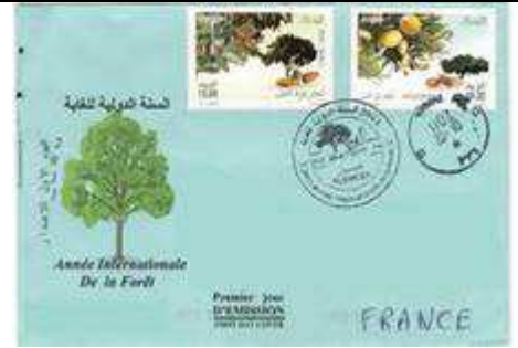
L'arganier sur le timbre de droite. Source : K. Krim / Impr. Banque d'Algérie. 2011, l'année internationale de la Forêt. http://id-mestimbres.blogspot.fr/2011/05/quelques-emissions-algeriennes.html