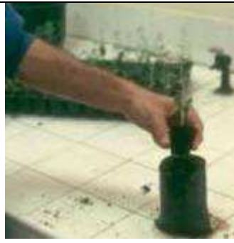
Transplantation en pot