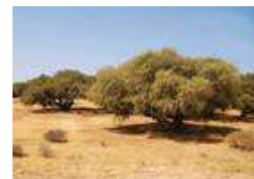
Plantation d'arganier.