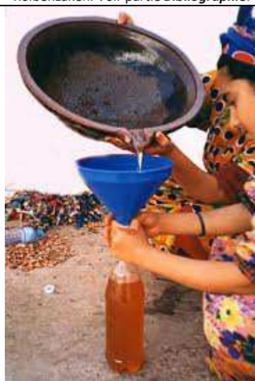
Filtration de l'huile.