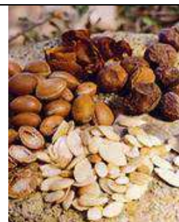
Source : Culture et cueillette de l'argane, © Rolbenzaken. Voir partie Bibliographie .