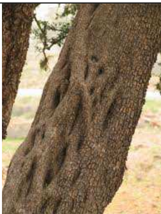
Tronc d' Argania spinosa , ©François Meignant, http://calphotos.berkeley.edu/cgi/img_query?enlarge=0000+0000+1009+1517