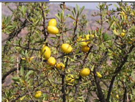
Fruits de l'arganier (région d'Essaouira, Maroc).