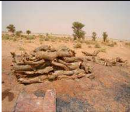
Déprédation, par coupe charbonnière, région de Tindouf (Algérie). www.dz.undp.org/Projets_Cooperation/docum entation_support/Bulletin-ProjetALG35.pdf