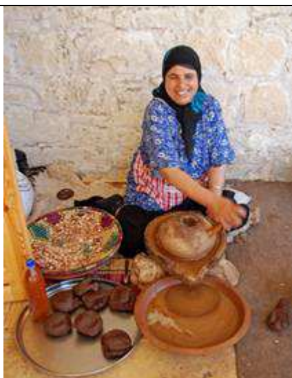
Moulin manuel à moudre les graines en pierre. Source : Culture et cueillette de l'argane, © Rolbenzaken. Voir Bibliographie .