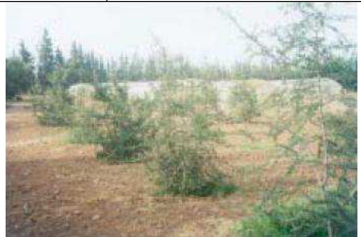
Transplantation au Champ.