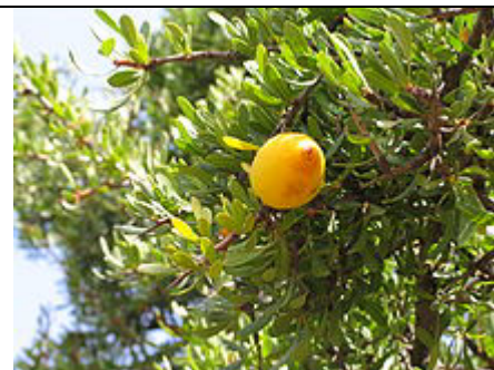
Fruit de l'arganier (région d'Essaouira, Maroc).