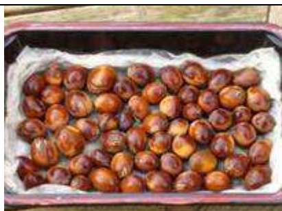
Source : Culture et cueillette de l'argane, © Rolbenzaken. Voir partie Bibliographie .