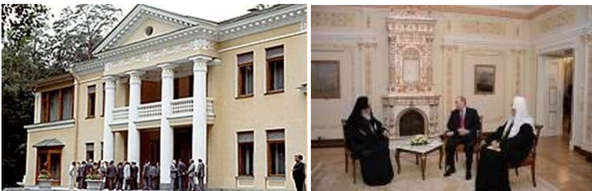
Novo-Ogarevo : La datcha gouvernementale de Novo-Ogarevo.

Poutine a redéveloppé un système identique à celui de la momenklatura [l'élite du parti] avec ses apparatchik [membre de la nomenklatura , cadre supérieur du gouvernement ou du parti ], favorisant le retour d'un système de privilèges , dont bénéficient les proches du pouvoir.