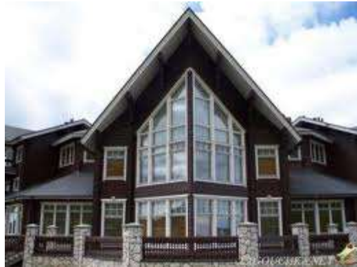
↑ ↗ Krasnaïa Poliana : Datcha de Vladimir sur le site de Krasnaïa Poliana , station de ski située à l'extrémité occidentale du Caucase, en Russie, près de la ville de Sotchi et des côtes de la mer Noire.