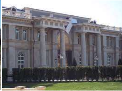
Palais Dvoret Gelendzhik : La datcha de Vladimir Poutine sur la mer noire près de la ville de Sotchi.

« Quant à mes revenus personnels, je ne suis pas honte devant les citoyens qui ont voté pour moi. Car depuis huit ans, je travaille comme un forçat [...] ». Conférence de presse de Poutine, du 14 Février 2008, dans le Kremlin.