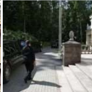
Novo-Ogaryovo : Situé dans les bois sur la route Rublevo-Ouspensky, entouré par un mur de six mètres. Dans cette propriété : serres, volière, piscine, plusieurs bâtiments résidentiels, hélicoptère, écuries.