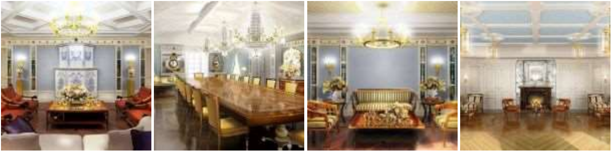
Milowka : Manoir à ? km de la ville de Ples, sur la rive droite de la Volga. Un monument de l'histoire, de l'architecture, de l'art du paysage de la fin XVIII siècle et du début du XX siècle.