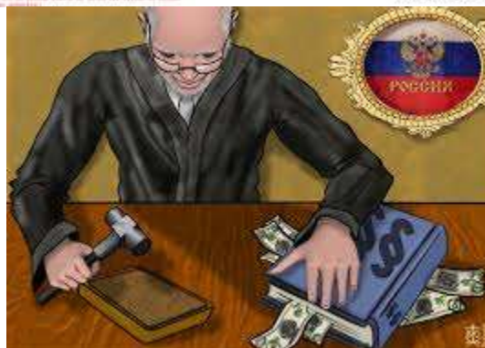
La justice est extrêmement corrompue en Russie.