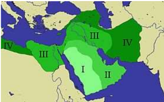
Expansion arabe sous Mahomet (I) et les trois premiers califes, Abou Bakr (II), Omar (III) et Uthman (IV). (Wikipedia)