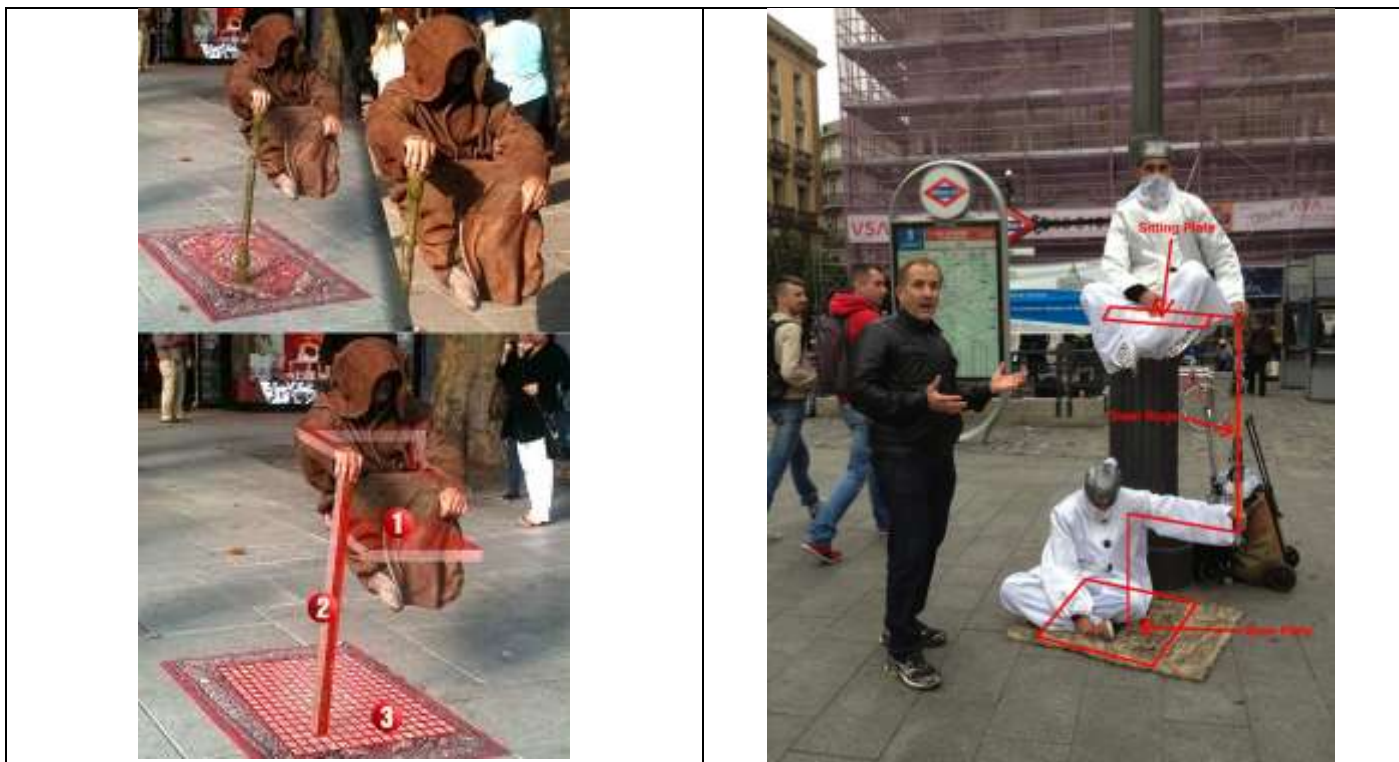
Portique pour supporter le poids des illusionnistes de rue.